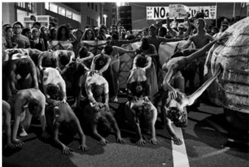
ERIKA P. RODRÍGUEZ (Puerto Rico) In the struggle: Education II / En la lucha: Educación II , 2010 Digital print with matte frame, 11" x 14"